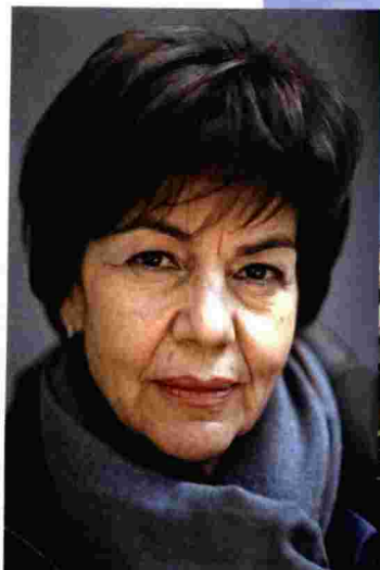
«AT CROSSROADS» (2009, ΒΕΡΟΛΙΝΟ).