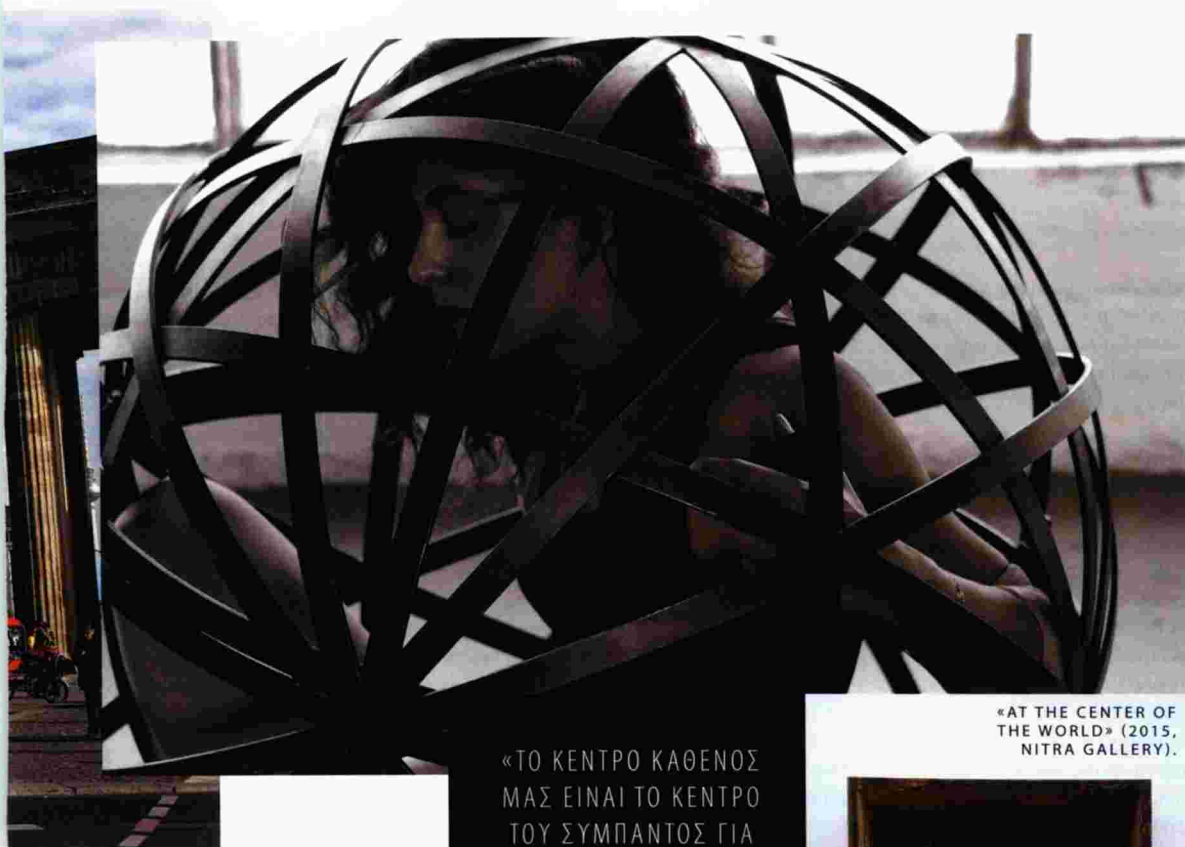
«AT THE CENTER OF THE WORLD» (2015, NITRA GALLERY).

«ΤΟ ΚΕΝΤΡΟ ΚΑΘΕΝΟΣ ΜΑΣ ΕΙΝΑΙ ΤΟ ΚΕΝΤΡΟ ΤΟΥ ΣΥΜΠΑΝΤΟΣ ΓΙΑ ΚΑΘΕΝΑΝ ΜΑΣ. ΕΚΕΙ ΒΡΙΣΚΟΝΤΑΙ Η ΔΥΝΑΜΗ, Η ΙΣΟΡΡΟΠΙΑ ΚΑΙ Η ΠΡΟΣΩΠΙΚΗ ΕΛΕΥΘΕΡΙΑ».