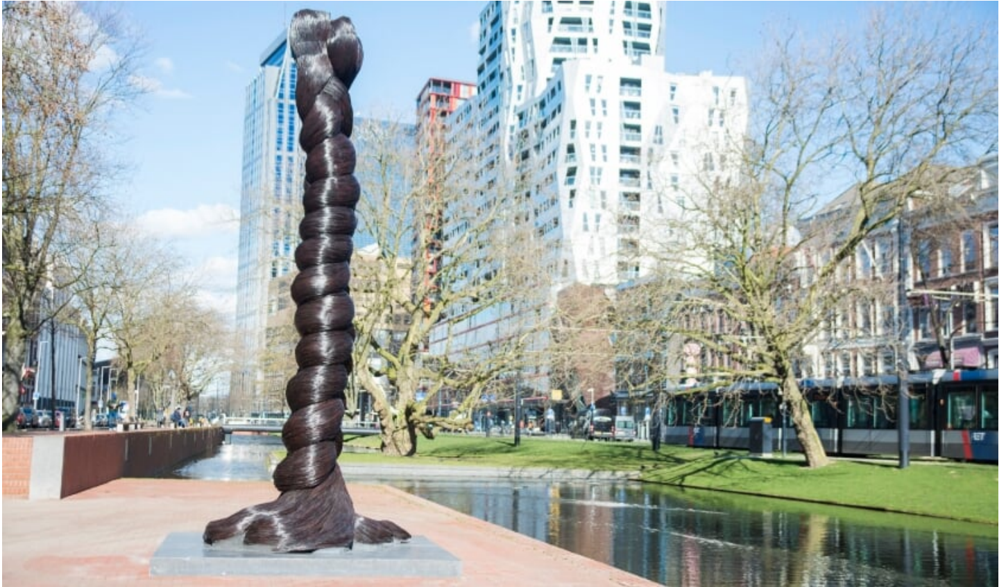
De Vlecht aan de Westersingel.